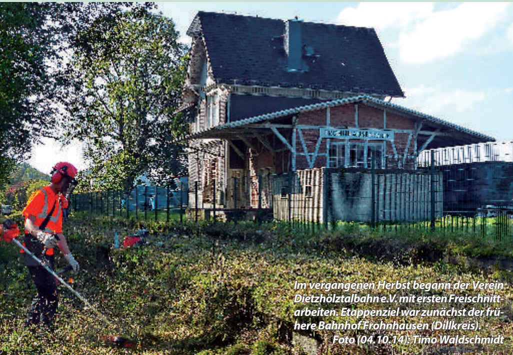
Im vergangenen Herbst begann der Verein Dietzhöhlzalbahn e.V. mit ersten Freischnittarbeiten. Etappenziel war zunächst der frühere Bahnhof Frohnhausen (Dillkreis).

Ein emsiger Verein treibt die Reaktivierung der mittelhessischen Nebenbahn Dillenburg – Ewersbach voran